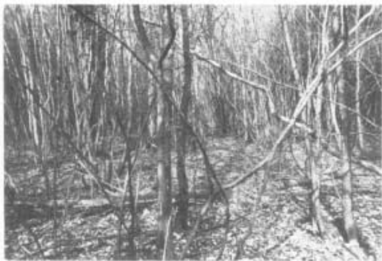
Foto 2 - Il Fraxino-Carpineto , nell'arca di R.N.I. della «Balanzetta», nel suo aspetto tardo-invernale.