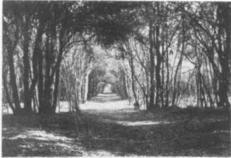
Foto 3 - La lecceta fitta del Bosco Mesola, all'inizio della primavera, con una stradelle di servizio forestale.