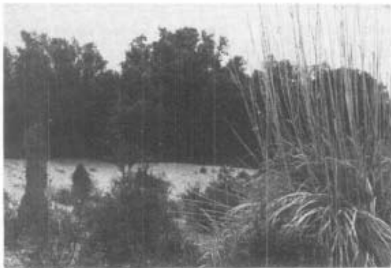
Foto 1 - Un caratteristico aspetto dei cordoni dunali nel lembo sud/est del Bosco Mesola. Sullo sfondo si nota la barriera dei lecci arbustivi, e in primo piano, oltre a giovani ginepri e lecci nani, la «canna di Ravennà».