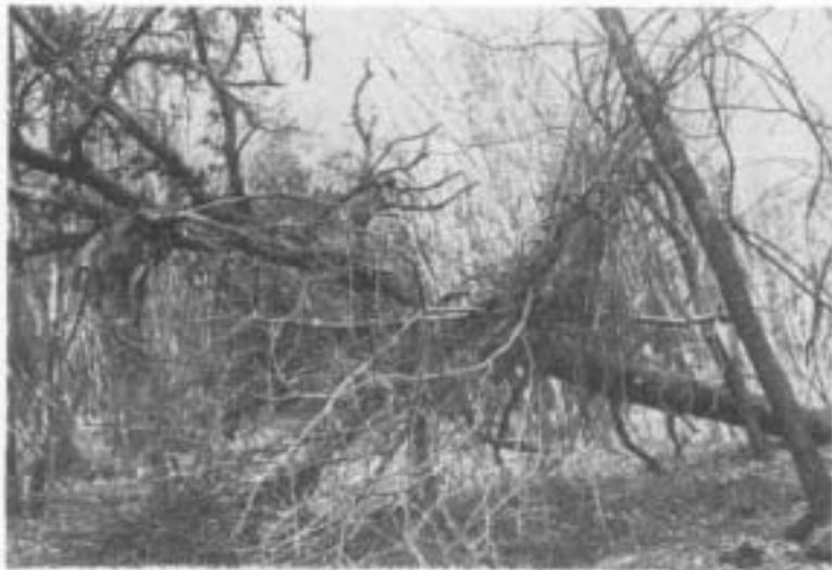
Foto 4 - Grandi lecci deperenti caduti al suolo, come questo, non è difficile trovarli finito l'inverno nelle zone più fitte del «boscone» di Mesola. Queste piante a terra sono preziose per effettuare campionamenti e stime sulle infestazioni xilofaghe delle parti più alte del soprassuolo arboreo.