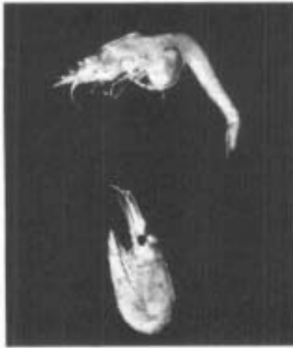
Fig. 2 - Diamysis bahirensis (G.O. Sars), 1. Sile. -7-1977

La segnalazione di questa specie dalla nostra Staz. 2 (a monte di Treviso ed in zona interessata da affioramenti di polle sorgive) viene a costituire il primo reperto italiano di Misidacei in acque dolci superficiali. La popolazione campionata appare consistente (150 esemplari raccolti!); come risulta dalla Tab. 6, essa è presente fra le macrofite sommerse costiere soprattutto nella tarda primavera e in estate; in luglio abbiamo osservato numerose femmine ovigere (fig. 2).