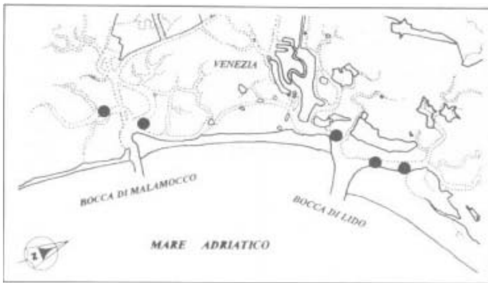
Fig. 2 - Laguna di Venezia con indicazione delle stazioni a Celleporella carolinensis .

misurata all'atto del prelievo nelle diverse occasioni è sempre stata superiore al 30‰.