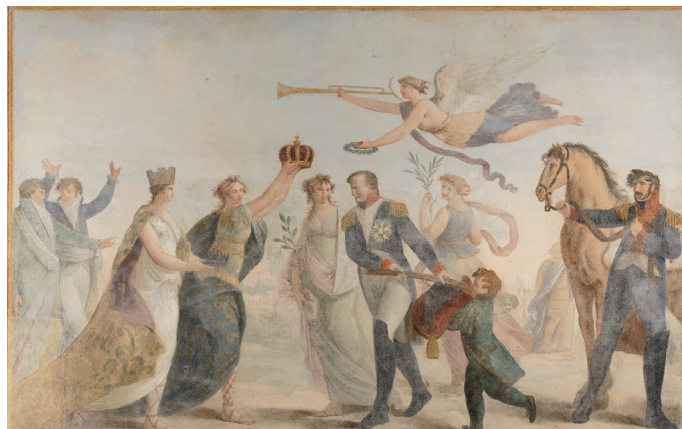
Giovanni Carlo Bevilacqua, Allegoria napoleonica , palazzo Loredan, mezzanino

dell'antica sede, l'adunanza solenne che chiude l'anno accademico dell'Istituto Veneto si tiene nel palazzo dei dogi, nella sala dello Scrutinio.