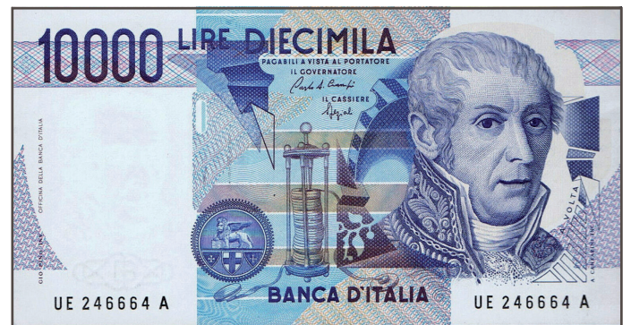
Ritratto di Alessandro Volta sulla banconota da 10.000 lire

al più famoso scienziato italiano: quell'Alessandro Volta (1745-1827) la cui immagine abbiamo visto nelle vecchie 10.000 lire color celeste. In esse egli è ritratto con accanto l'immane pila e addosso l'uniforme – appunto – dell'Istituto Reale di scienze, lettere ed arti: una divisa nera con fregi verdi.